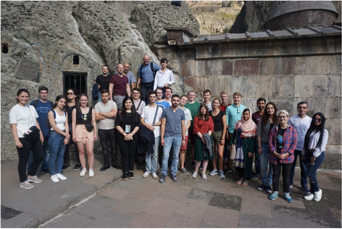
Посещение монастыря Гегард