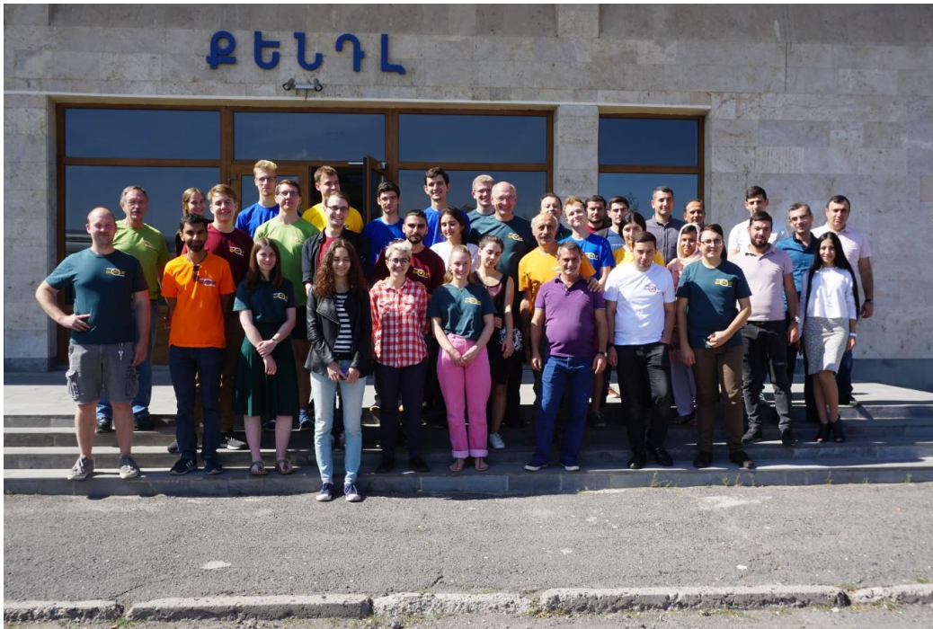
Немецкие и армянские студенты, преподаватели, коллектив института перед главным входом в ИСИ “КЕНДЛ”